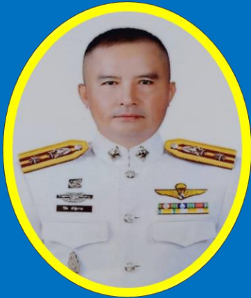
พ.ต.ท.วิฑูฒติ สมภักดี