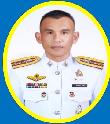
พ.ต.อ.วิเชิต ศรีสุนารณ